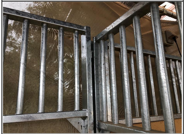
前面と背面は引っ掛け金具で

スライドドアは事故防ぐため 脱落防止ユニットを装備して います。※SDを吊り下げた 後に取り付け。