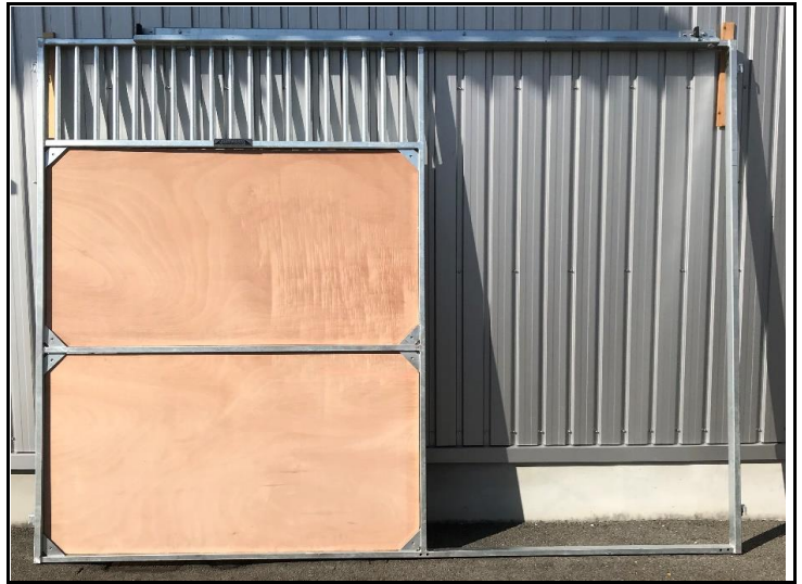
前面パネルとスライドドアレール