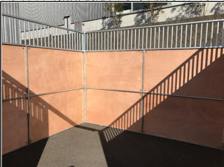
左：間仕切りP 右：背面P

スライドドアは操作棒を引き下げてロック解除したうえで、そのまま持ち替えることなくドアの開閉操作ができます。