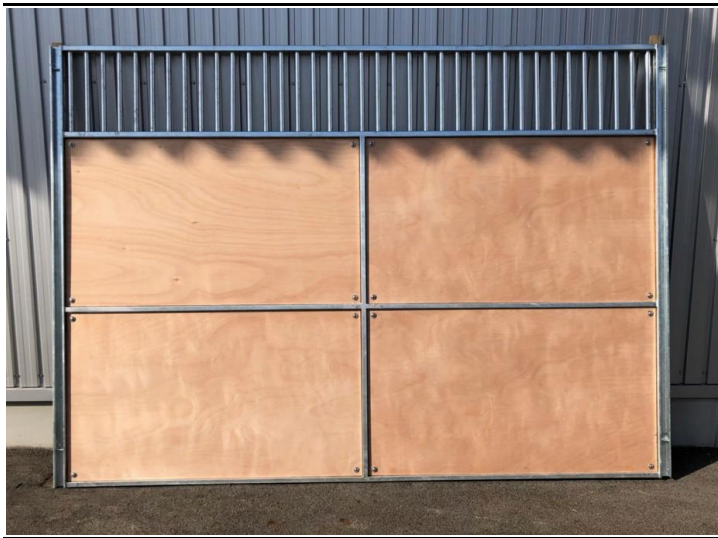
間仕切りパネル(本図)/背面パネル